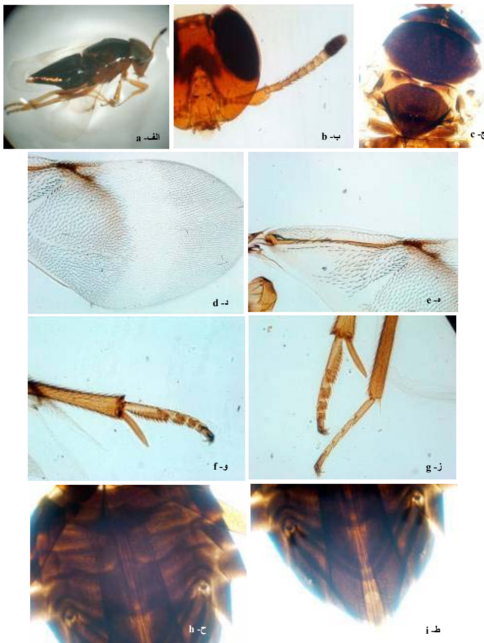
شکل ۲- ویژگی‌های مورفولوژیک زنبور Microterys cuprinus : الف- حشره کامل، ب- شاخک، ج- قفسه سینه، د، ه- بال جلو،

و- پای میانی، ز- پاها میانی و عقبی، ح، ط- شکم